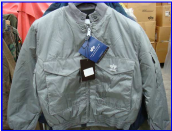
Wep Flying Jackets Vintage Disponibile nella versione Made in USA e nella versione Made in Vietnam